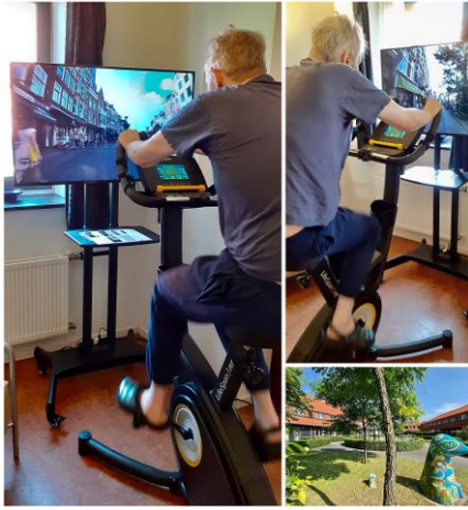
1 Fietslabyrinth Mauritzhof

In bijlage 1 is een overzicht van de projecten opgenomen, waarvan een inhoudelijke en financiële rapportage is ontvangen.