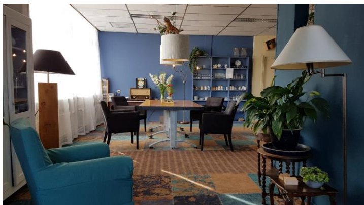
2 Een nieuw dak voor bezoekers van Viore