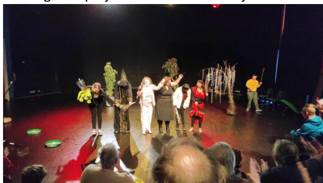
2 Culturele activiteiten Spotlight Theater

Voor de afronding van de volgende projecten is een inhoudelijke en financiële rapportage ontvangen.