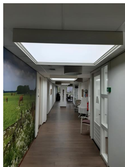
1 Biodynamische verlichting Eemhof

In bijlage 1 is een overzicht van de projecten opgenomen, waarvan een inhoudelijke en financiële rapportage is ontvangen.